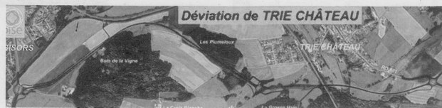
La déviation contournera Trie-Château et le bois de la Vigne.

AG collectionneurs. L'Amicale des collectionneurs de Gisors et de sa région tiendra sa prochaine réunion et assemblée générale ordinaire samedi 11 mars à 14h à la salle charpillon (angle de la mairie, coté poste).